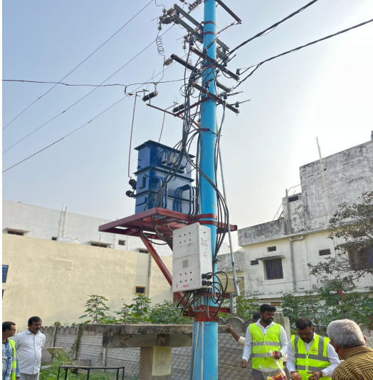
శనివారం జరిగిన కార్యక్రమంలో పీర్బాదిగూడ మున్సిపల్

వీర్బాదిగూడ, రాజముద్ర న్యూస్: మల్కాజిగిరి మున్సిపల్ కార్పొరేషన్ పరిధిలోని బోడుప్పల్ సర్కిల్ 10వ డివిజన్ పీర్బాదిగూడ, శ్రీరామ ఆర్.టి.సి కాలనీలో దీర్ఘకాలంగా నెలకొన్న విద్యుత్ సమస్యకు శాశ్వత పరిష్కారం లభించింది. కాలనీవాసుల విజ్ఞప్తి మేరకు విద్యుత్ శాఖ అధికారులు యుద్ధప్రాతిపదికన స్పందించి, నూతన ట్రాన్స్ ఫార్మర్ ను అందుబాటులోకి తీసుకువచ్చారు.