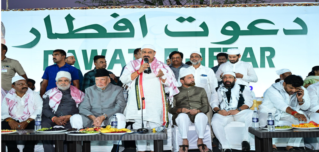
విభాగం ప్రతినిధులు, యువజన నాయకులు పెద్ద సంఖ్యలో ముస్లిం సోదరులు పాల్గొన్నారు.