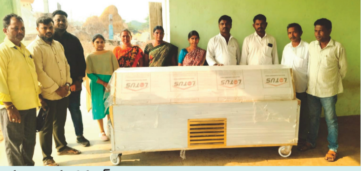
ఖమ్మం, రాజముద్ర న్యూస్..