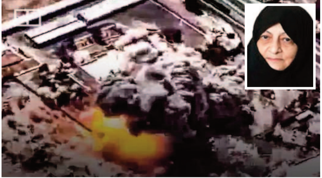
సెక్యూరిటీ కౌన్సిల్ కార్యదర్శి అలీ లరిజానీ ఖండించారు. అమెరికాతో చర్చల ప్రసక్తే లేదని తేల్చి చెప్పారు.

నెతన్యాహు కార్యాలయమే లక్ష్యంగా.. సుప్రీం లీడర్ మరణంతో రగిలిపోతున్న ఇరాన్ ఇస్లామిక్ రివల్యూషనరీ గార్డ్ కార్పిస్ (ఐఆర్ జీసీ) ప్రతికార దాడులను ముమ్మరం చేసింది. టెల్ అవీవ్ లోని ఇజ్రాయెల్ ప్రధాని బెంజమిన్ నెతన్యాహు, ఎయిర్ ఫోర్స్ కమాండర్ కార్యాలయాలను తమ 'బైబెల్ షెకాస్' బాలిస్టిక్ క్షిపణి విజయవంతంగా డీకాట్టింగ్ దిని ఐఆర్జీసీ సంవలన ప్రకటన చేసింది. అయితే దీనిని ఇజ్రాయెల్ ఇంకా ప్రతికరించలేదు. అంతకుముందు ఇరాన్ జరిపిన క్షిపణి దాడుల్లో జెనూవాలి సమీపంలోని బీట్ షెమ్షల్ 10 మంది మృతి చెందారు. యుద్ధాన్ని ఆపేందుకు మధ్యవర్తులతో చర్చలు జరుపుతున్నారన్న వార్తలను ఇరాన్ నేషనల్