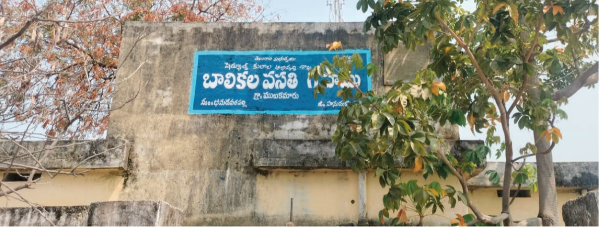
భీమవేలవల్లి, రాజముద్ర న్యూస్

భయానక వాతావరణంలో చదువులు ప్రాణభద్రతపై అనుమానాలు తక్షణ చర్యలకు స్థానికుల డిమాండ్