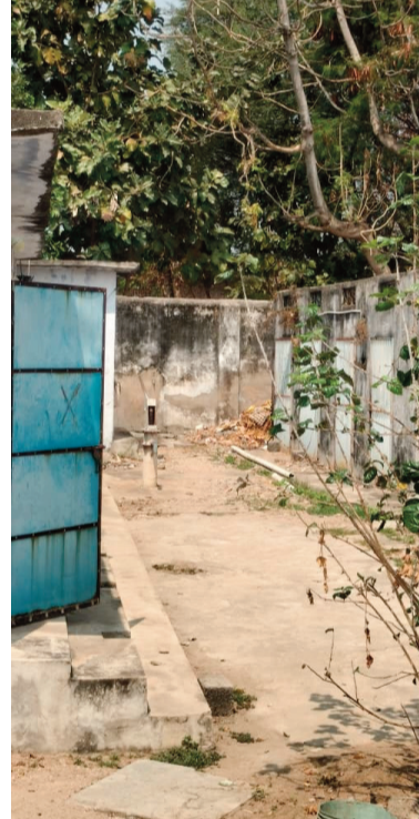
ఎందాకాలంలోనే కొత్త భవన నిర్మాణం చేపట్టాలి

వేసవి కాలం కొనసాగుతున్న నేపథ్యంలో వర్షాల రాకముందే పాత భవనాన్ని ఖాళీ చేసి ప్రత్యామ్నాయ వసతి కల్పించాలని, అదే సమయంలో కొత్త భవన నిర్మాణ పనులు ప్రారంభించాలని స్థానికులు గట్టిగా డిమాండ్ చేస్తున్నారు. ఆలస్యం జరిగితే ప్రమాదం తప్పదని హెచ్చరిస్తున్నారు.