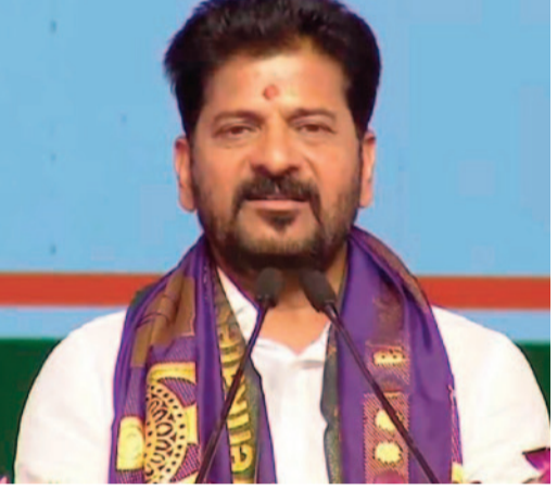
తెలంగాణ ఇచ్చిన నేతగా సోనియా పేరు బిరస్టాగా ఉంటుందని అన్నారు. త్యాగాలు చేసిన కుటుంబం వారిని అన్నారు.

రేవంత్ రెడ్డి మాట్లాడుతూ.. ప్రజా జీవితంలో తానెప్పుడూ పైరవీలు చేయలేదన్నారు. గతంలో ప్రజాసమస్యలపై గళం విప్పిన తనపై కేసులు నమోదు చేశారని గుర్తు చేసుకున్నారు. ఆదివారం సైతం తాను కోర్టుకు వెళ్లినట్లు చెప్పుకొచ్చారు. ఈ 19 ఏళ్లలో జడ్జిటీసీ నుంచి తాను సీఎం అయ్యానని గుర్తు చేసుకున్నారు. ఆ క్రమంలో పార్టీ పదవులు సైతం నిర్వహించానని చెప్పారు. ఎమ్మెల్యేగా తాను మంచి అనుభవం పొందానన్నారు. తనపై అనేక కేసులు పెట్టారని.. పరుపు నష్టం దావాలు కూడా వేశారని పేర్కొన్నారు. దేశం కోసం, తమ కోసం రాహుల్ గాంధీ ప్రధాని కావాలని పేర్కొన్నారు. సోనియా గాంధీ పేరుతోనే తెలంగాణలో అధికారంలోకి వచ్చామని వివరించారు. బడెళ్లు చేసిన పోరాటాల వల్ల రాహుల్ గాంధీ ప్రధాన ప్రతిపక్ష నేత అయ్యానని వివరించారు. దేశం కోసం రాహుల్ గాంధీ ప్రధాని కావాలన్నారు. దేశంలో అనేక సమస్యలపై రాహుల్ గాంధీ పోరాటం చేశారని ఈ సందర్భంగా సీఎం రేవంత్ రెడ్డి గుర్తు చేసుకున్నారు.