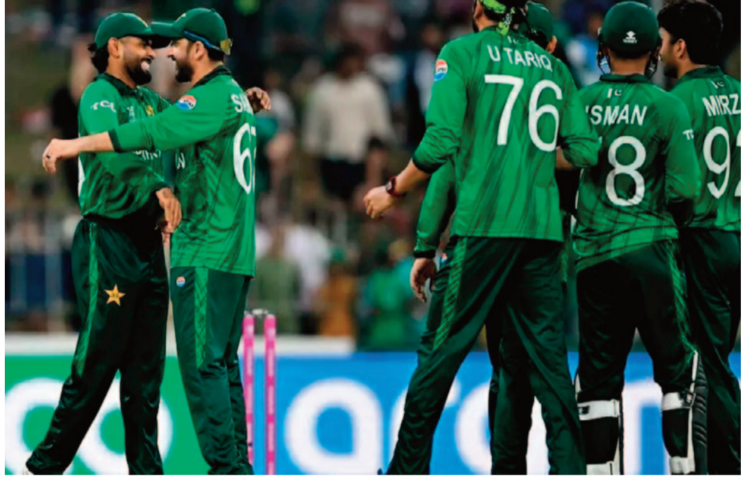
వరల్డ్ కప్ 2026లో సూపర్ 8 దశలోనే నిష్క్రమించింది. దీంతో పీసీబీ ఆటగాళ్లపై భారీ పైన్లు విధించింది (ప్రతి ఆటగాడికి పీకేఆర్ 5 మిలియన్). బాబర్ అజామ్, సైమ్ అయూబ్, మొహమ్మద్ నవాజ్ వంటి సీనియర్లను ఈ ఓడీబి సిరీస్ కు డ్రావ్ చేసే అవకాశం ఉందని రిపోర్టులు వచ్చాయి. యువ ఆటగాళ్లకు అవకాశం ఇవ్వాలని పీసీబీ ఆలోచిస్తోంది. ప్రస్తుతం సిరీస్ భవిష్యత్ పూర్తిగా మిడిల్ ఈస్ట్ పరిస్థితులపై ఆధారపడి ఉంది. పరిస్థితి మెరుగుపడకపోతే రెండు బోర్డుల మధ్య చర్చలు జరిగి సిరీస్ పోస్టపోస్ట్ అయ్యే అవకాశం ఉంది.

పాకిస్తాన్-బంగ్లాదేశ్ సిరీస్ కప్పాల్సి.. ఈ సిరీస్ ఇప్పుడు రద్దు అయ్యే అవకాశం