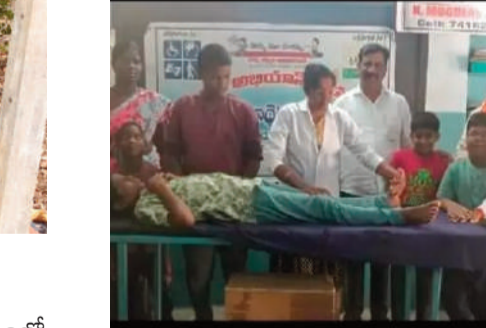
పిట్లం, రాజముద్ర న్యూస్: