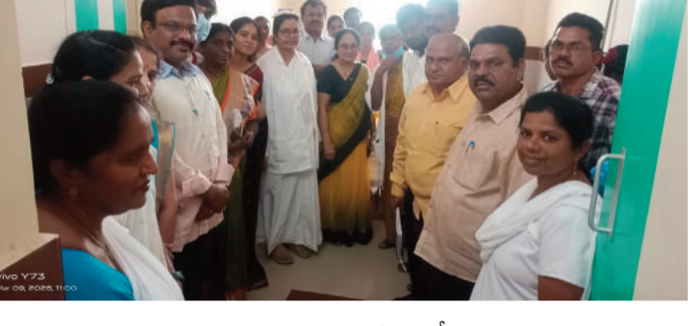
ఖమ్మం, రాజముద్ర న్యూస్: