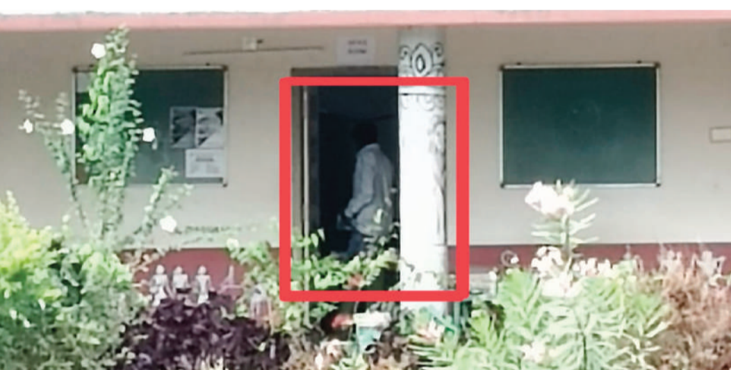
ఖమ్మం, రాజముద్ర న్యూస్:

ముదిగొండ మండల కేంద్రంలోని వృశుత్వ జూనియర్ కళాశాలలో మాస్ కాపీయింగ్ యధేచ్ఛగా కొనసాగుతుంది. సెల్ఫ్ సెంటర్ కావడంతో అదునుగా బావిచి అసాధికారిక వ్యక్తులు ఇష్టానుసారీ మాస్ కాపీయింగ్ నడిపిస్తూ కాసులు కొలగొడుతున్నారనే ఆరోపణలు సర్వత్రా వినిపిస్తున్నాయి. దీనికి తోడు వృత్తి విద్యా కోర్స్ కి సంబంధించిన ఓ ఒప్పంద అధ్యాపకులతో స్వయంగా ఈ తరంగం అంతా నడిపిస్తున్నట్లుగా విస్తృత ప్రచారం జరుగుతోంది. ఖమ్మం జిల్లా కేంద్రానికి కూతవేలు దూరంలో మాస్ కాపీయింగ్ కార్యకలాపాలు జరుగుతున్న ఉన్నతాధికారులు నిలువరించకపోవడం లేదనే విమర్శలు వెల్లువెత్తుతున్నాయి. మహిళా అధ్యాపకురాలే "కీ" రోల్..!