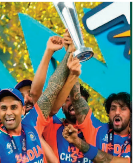
ఢిల్లీ: 2026 టీ20 ప్రపంచకప్లో భారత జట్టు అద్భుత విజయంపై పాకిస్తాన్ మాజీ ఫ్లేయర్ షోయబ్ అక్తర్ ప్రశంసల వర్షం కురిపించాడు. టీమిండియా అద్భుత

భారత క్రికెట్ వ్యవస్థకు సలాం అంటూ షాకింగ్ కామెంట్స్