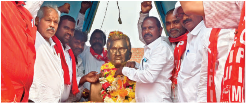
ఖమ్మం, రాజముద్ర న్యూస్: