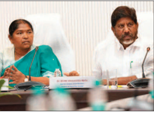
పూర్తి స్థాయిలో విడుదల చేయించుకోవాలని అధికారులను ఆదేశించారు. గత ప్రభుత్వ నిర్ణయాల వల్ల పెండింగ్లో

పంచాయతీరాజ్ వ్యవస్థ ఐలోపేతానికి ప్రభుత్వం కట్టుబడి ఉందని మంత్రి సీతక్క స్పష్టం చేశారు. కేంద్రం నుంచి రాష్ట్రానికి రావాల్సిన 15వ ఆర్థిక సంఘం నిధులను