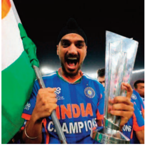
చేరింది. కేవలం పురుషుల జట్టే కాకుండా, గతేడాది మహిళల వన్డే ప్రపంచకప్ ను హర్మన్ ప్రీత్ సేన

గెలుచుకోవడం భారత క్రికెట్ లో నవకానికి నాంది పలికింది. నేడు దేశంలో క్రికెట్ కేవలం ఒక ఆట మాత్రమే కాదు, దాదాపు 100 కోట్ల మందిని ఏకం చేసే ఒక భావోద్వేగంగా మారింది.