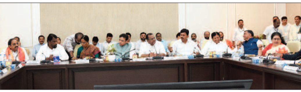
గ్రామాల్లో త్వరలోనే రీ-సర్వే చేపట్టబోతున్నామని, దీని కోసం బడ్జెట్ లో తగిన నిధులు కేటాయించాలని కోరారు. భూ సమస్యల పరిష్కారంలో జాప్యాన్ని నివారించడానికి ప్రభుత్వం కీలక నిర్ణయం తీసుకుంది. రెవెన్యూ, స్టాంప్స్ అండ్ రిజిస్ట్రేషన్, సర్వే విభాగాలను