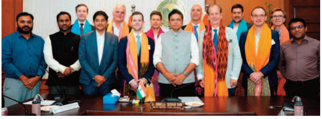
స్థిరత్వాన్ని కల్పిస్తున్నామని వివరించారు. భౌగోళికంగా భారతదేశం సడిబోడ్డు ఉన్న హైదరాబాద్ ఏడాది పొడవునా అభివృద్ధికి వాతావరణం, విద్యుత్ సంస్కృతుల సమృద్ధినితో కూడిన కాస్టోపాలిటన్ జీవనశైలితో ప్రపంచం నలుమూలల నుంచి వచ్చే వారికి 'సొంత ఊరు' అనే భావన కలిగిస్తోందని మంత్రి పేర్కొన్నారు. నగరం దక్షిణ భాగంలో ప్రతిష్టాత్మక 'ఫ్యూచర్ సిటీ' ప్రాజెక్టు వేగంగా రూపుదిద్దుకుంటోందని తెలిపారు. ఇందులో భాగంగా ఏర్పాటువుతున్న ఏబి సిటీ, నెట్ జీరో సిటీ, యంగ్ ఇండియా స్కైల్స్ యూనివర్సిటీ వంటి ప్రాజెక్టులు రాష్ట్ర భవిష్యత్తుకు బలమైన పునాది వేస్తాయని అన్నారు. తెలంగాణలో ఆహారమైన మానవ వనరులు, టాలెంట్ ఫూల్ అందుబాటులో ఉండటంతో పరిశ్రమలకు నిపుణుల కొరత తలెత్తే సమస్య ఉండదని స్పష్టం చేశారు. ఇప్పటికే ఉద్యోగాల్లో ఉన్న పుత్రి నిపుణులతో పాటు కొత్తగా