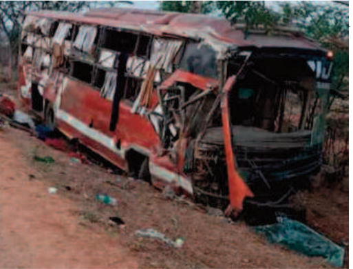
బయటకు తీసేందుకు రెస్క్యూ బృందాలు శ్రమించాయి. ఈ ఘటనతో జాతీయ రహదారిపై ట్రాఫిక్ జాం అయింది. అనంతరం ట్రాఫిక్ ను క్లియర్ చేసి వాహనాల రాకపోకలను పునరుద్ధరించారు. ఈ ప్రమాదంపై పోలీసులు కేసు నమోదు చేసి దర్యాప్తు ప్రారంభించారు. డ్రైవర్ నిద్రాస్థితి, ఇతర సాంకేతిక కారణాల వల్ల ప్రమాదం జరిగిందా అనే కోణంలో విచారణ చేస్తున్నారు.

బోల్తా పడింది. ఈ ప్రమాదం గన్నారం గ్రామ శివారులోని బ్రాహ్మణిగారి ఆలయం దగ్గర చోటుచేసుకుంది. ఈ ఘటన జరిగిన సమయంలో బస్సులో 36 మంది ప్రయాణికులు ఉన్నారు. ఈ బస్సు హైదరాబాద్ నుంచి నాగపూర్ వెళ్తుంది. ప్రమాదం జరిగిన వెంటనే స్థానికులు గాయపడిన వారిని బయటకు తీసేందుకు ప్రయత్నించారు. ఈ క్రమంలో పోలీసులకు, అత్యవసర సేవలకు సమాచారం అందించారు. ఈ ప్రమాదంలో నలుగురు ప్రయాణికులు అక్కడికక్కడే ప్రాణాలు కోల్పోయినట్లు పోలీసులు తెలిపారు. బస్సు బోల్తా పడిన సమయంలో తీవ్ర గాయాల కారణంగా వారు మృతి చెందినట్లు తెలుస్తోంది. మృతుల వివరాలను అధికారులు సేకరిస్తున్నారు. ఈ ఘటనతో మృతుల కుటుంబాల్లో తీవ్ర విషాదం నెలకొంది. ప్రమాదంలో పలువురు ప్రయాణికులు గాయపడగా వారిని స్థానికుల సహాయంతో సమీపంలోని ఆస్పత్రులకు తరలించారు. కొందరి పరిస్థితి విషమంగా ఉండటంతో మెరుగైన చికిత్స కోసం ఇతర పెద్ద ఆస్పత్రులకు తరలించినట్లు సమాచారం. వైద్యులు గాయపడిన వారికి చికిత్స అందిస్తున్నారు. బస్సులో చిక్కుకున్న వారిని