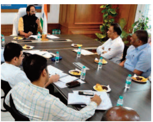
ఆయన హెచ్చరించారు. మొత్తానికి, సామాన్యుడి వంటింట్లో మంట ఆరిపోకుండా ప్రభుత్వం అన్ని జాగ్రత్తలు తీసుకుంటోందని ఆయన భరోసా ఇచ్చారు.