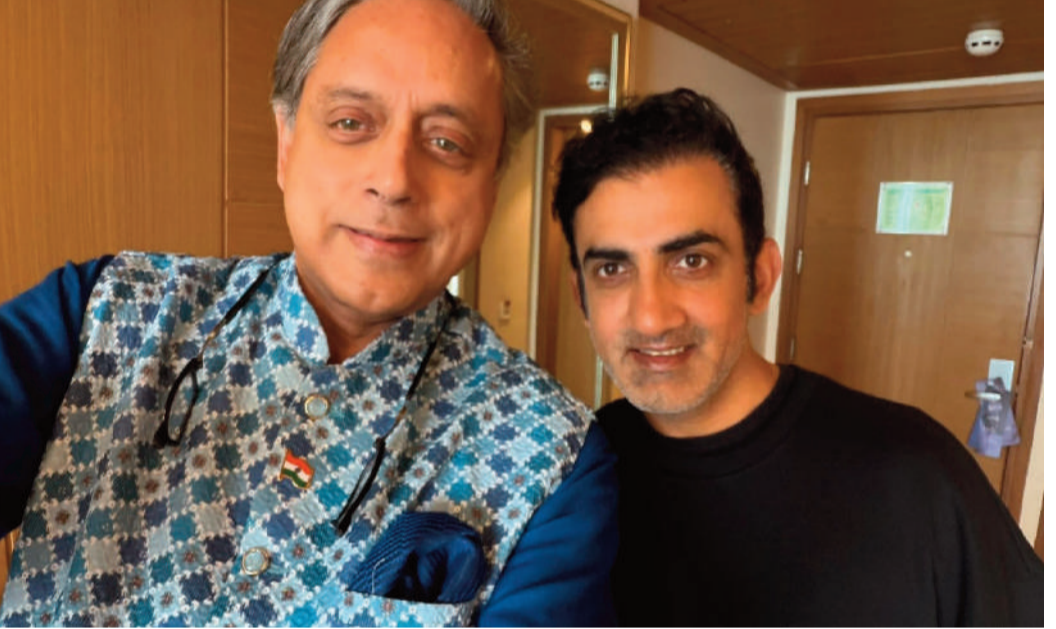
పడుతున్నారు. ఇక గంభీర్ వంటి అనుభవజ్ఞుడైన కోచ్ నుంచి ఇలాంటి మద్దతు లభించడం సంజూ కెరీర్ కు ఎంతో ఉపయోగపడుతుందని భావిస్తున్నారు. యువ ఆటగాళ్లపై అవకాశాలు లభిస్తే జట్టుకు కీలక ఆటగాడిగా మారగల సామర్థ్యం ఉందని క్రీకెట్ విశ్లేషకులు కూడా అభిప్రాయపడుతున్నారు. ఇక గంభీర్ వంటి అనుభవజ్ఞుడైన కోచ్ నుంచి ఇలాంటి మద్దతు లభించడం సంజూ కెరీర్ కు ఎంతో ఉపయోగపడుతుందని భావిస్తున్నారు. యువ ఆటగాళ్లపై అవకాశాలు లభిస్తే జట్టుకు కీలక ఆటగాడిగా మారగల సామర్థ్యం ఉందని క్రీకెట్ విశ్లేషకులు కూడా అభిప్రాయపడుతున్నారు.

భారత జట్టు సారీ వికెట్ కీపర్ బ్యాటర్ సంజూ శాంసన్ గురించి టీమిండియా హెడ్ కోచ్ గౌతమ్ గంభీర్ చేసిన వ్యాఖ్యలు ఇప్పుడు క్రీకెట్ వరల్డ్ వినూత్న చర్చకు దారితీశాయి. సంజూను మహేంద్ర సింగ్ ధోనీతో పోల్చాల్సిన అవసరం లేదని గంభీర్ అభిప్రాయపడ్డారని కాంగ్రెస్ ఎంపీ శశిధరూర్ వెల్లడించడం ఈ అంశాన్ని మరింత ఆసక్తికరంగా మార్చింది. ఇటీవల గంభీర్ కో జరిగిన సంభాషణను ప్రస్తావించిన శశిధరూర్, సంజూ శాంసన్పై గంభీర్ కు ఉన్న అనుబంధాన్ని వివరించారు. "సంజూ నాకు మామయ్యలాంటి వ్యక్తి" అని గంభీర్ చెప్పినట్లు ఆయన తెలిపారు. అంటే సంజూ ఎదుగుదలపై తాను ప్రత్యేక శ్రద్ధ చూపిస్తున్నానని, అతడిని సరైన దిశలో నడిపించాలని భావిస్తున్నానని గంభీర్ చెప్పిన భావన ఈ వ్యాఖ్యల్లో స్పష్టమవుతోంది. సంజూ శాంసన్ ను తరచుగా ధోనీతో పోల్చుతూ వస్తున్న నేపథ్యంలో, అలాంటి పోలికలు యువ ఆటగాడిపై అనవసర ఒత్తిడిని పెంచుతాయని గంభీర్ భావించినట్లు తెలుస్తోంది. ప్రతి ఆటగాడికీ తనదైన శైలి, తనదైన ప్రయాణం ఉంటుందని, ఆ వ్యక్తిత్వాన్ని గౌరవించాల్సిన అవసరం ఉందని ఆయన అభిప్రాయపడ్డారని సమాచారం.