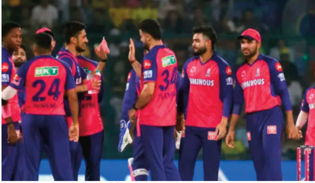
ప్రదర్శన ఇవ్వడంలో జట్టు వెనుకబడింది. ఇటీవలి సీజన్లలో ఫలితాలు సాధించలేక లీగ్ దశలోనే నిష్క్రమించింది. ప్రస్తుత కొంత మెరుగుపడటానికి, గత సీజన్లో మాత్రం ఆశించిన పనిస్థితుల్లో ప్రాంచైజీ భవిష్యత్తుపై ఆసక్తి నెలకొంది.