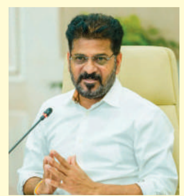
డిప్యూటీ సీఎం భట్టి బడ్జెట్ సీఎం రేవంత్ రెడ్డి అసెంబ్లీలో చిట్చాట్

హైదరాబాద్, మార్చి 20: అసెంబ్లీలో శుక్రవారం ప్రవేశపెట్టిన బడ్జెట్లో అభివృద్ధి, సంక్షేమానికి సమాన ప్రాధాన్యమిచ్చామని ముఖ్యమంత్రి రేవంత్ రెడ్డి అన్నారు. బడ్జెట్పై అసెంబ్లీలో ఆయన చిట్చాట్ మాట్లాడుతూ మిగతా 2వ పేజీలో..