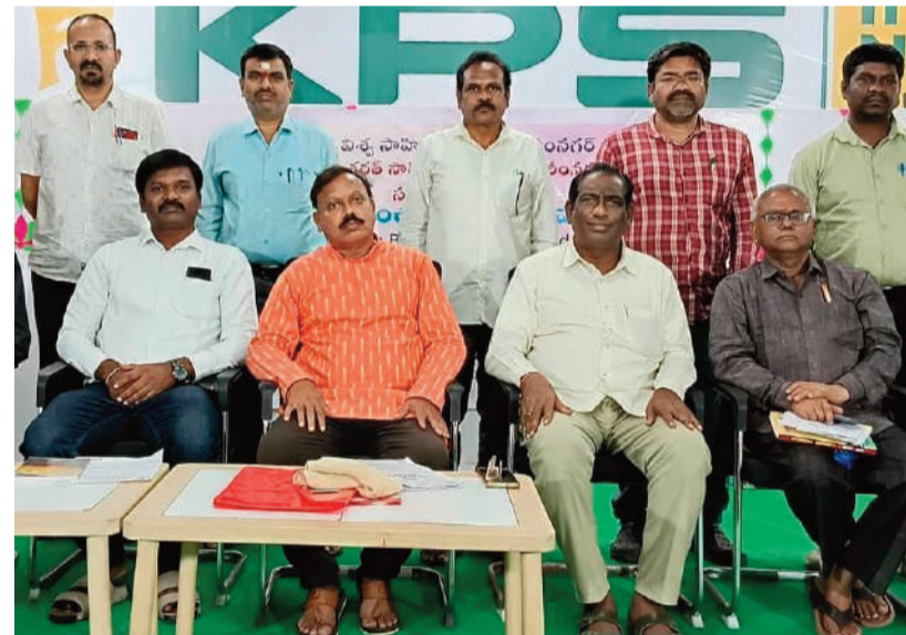
ఘనంగా కఠినగర్ లో ప్రపంచ కవితా దినోత్సవం!

రాజముద్ర న్యూస్, కఠినగర్, మార్చి 21: అమెరికా సామ్రాజ్య వాదం పెచ్చు పెరిగిపోయిందని, భూగోళ వినాశనానికి కంకణం కట్టుకుందని, యుద్ధాలను కవ్వెస్తూ పంచభూతాలను నాశనం చేస్తోందని, మానవ త్యాన్ని మరిచి అమానుషంగా ప్రవర్తిస్తోందని, ఇజ్రాయల్ తో కలిపి ఇరాన్ పై దాడి చేసి, పశ్చిమాసి యాను చమురు సంపదలను అతలాకుతలం చేసిందని శనివారం కోటా హైస్కూల్ లో జరిగిన ప్రపంచ కవితా దినోత్సవం సందర్భంగా కఠినగర్ లో జరిగిన కవి సమ్మేళనంలో పాల్గొన్న కవులు తమ నిరసనలను వ్యక్తం చేస్తూ కవితాల్పనా చదివారు. విశ్వ సాహితీ కళా వేదిక,