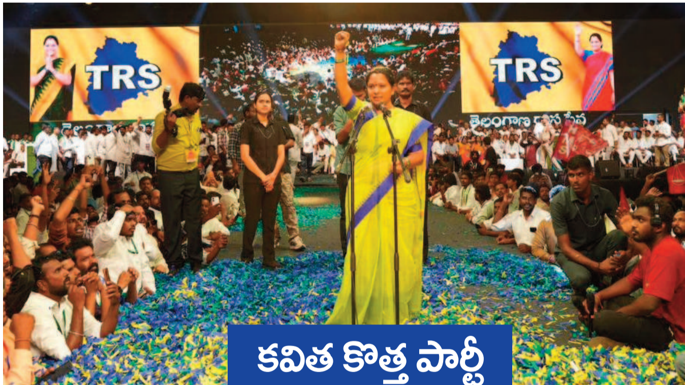
కవిత కొత్త పార్టీ