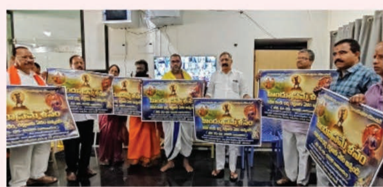
భద్రాచలంలో ఘనంగా హిందూ సమ్మేళన పోస్టర్ ఆవిష్కరణ

కలో భాగంగా మారథాన్, ఫిజికల్ లిటరసీ కార్యక్రమాలు, యువజన నాయకత్వ సదస్సు, స్పోర్ట్స్ డే వంటి కార్యక్రమాలు నిర్వహించనున్నట్లు తెలిపారు. యువతకు ఉపాధి అవకాశాలు కల్పించేందుకు మే 5 నుండి మే 12 వరకు జిల్లాలో జాబ్ మేళాలు నిర్వహించనున్నట్లు తెలిపారు. ఈ జాబ్ మేళాల ద్వారా వివిధ రంగాల్లో ఉపాధి అవకాశాలు లభిస్తాయని, నిరుద్యోగ యువత తప్పనిసరిగా పాల్గొని ప్రయోజనం పొందాలని సూచించారు. పోస్టర్ లో పొందుపరిచిన క్యూఆర్ కోడ్ లను స్కాన్ చేసి మొబైల్ యాప్ లేదా వెబ్ పోర్టల్ ద్వారా సమాచారం సేవకోవచ్చని తెలిపారు. యువత ఈ అవకాశాలను సద్వినియోగం చేసుకుని తమ భవిష్యత్తును మెరుగుపరచుకోవాలని పిలుపునిచ్చారు.