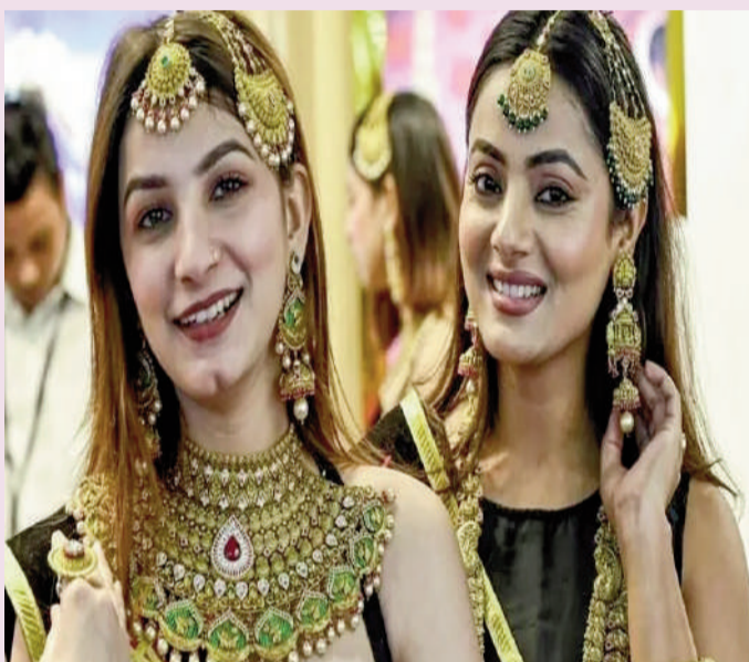
(మనసలో మాట, బజెస్ డెస్క్):

నానాటికీ ఆకాశాన్ని తాకుతున్న పసిడి ధరలు గత కొద్ది రోజులుగా తగ్గుముఖం పట్టడం వినియోగదారులకు పెద్ద ఊరటనిస్తోంది. దేశీయ మార్కెట్లో బంగారం ధరలు వరుసగా రెండో రోజు ఎలాంటి మార్పు లేకుండా స్థిరంగా కొనసాగుతున్నాయి. గత వారం రోజులుగా భారీగా తగ్గిన ధరలు, ఒక్కసారి మాత్రమే పెరిగి ప్రస్తుతానికి అదే స్థాయిలో నిలకడగా ఉన్నాయి. అంతర్జాతీయంగా పెరుగుతున్న ఉద్రిక్తతలు మరియు రికార్డ్ స్థాయిలో ఉన్న క్రూడ్ ఆయిల్ ధరలు ప్రభావం పసిడి ధరలు మరియు పెరుగుదల అడ్డుకుంటున్నట్లు బలియన్ మార్కెట్ నిపుణులు విశ్లేషిస్తున్నారు.