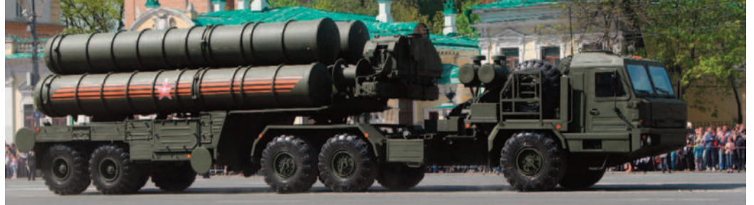
సత్తా చాటిన 'అపరేషన్ సింధూర్'

న్యూఢిల్లీ: భారత్ రక్షణ వ్యవస్థలో అత్యంత కీలకమైన ఎస్-400 ట్రియంఫ్ క్షిపణి వ్యవస్థ నాలుగో యూనిట్ అతి త్వరలో మన దేశానికి చేరుకోనుంది. మే నెల ప్రారంభంలోనే ఇది భారత్ కు అందుతుందని ప్రభుత్వ వర్గాలు వెల్లడించాయి. ఇప్పటికే రష్యా నుంచి ఈ యూనిట్ బయలుదేరినట్లు సమాచారం. 2018 అక్టోబర్ లో ఐదు యూనిట్ల కొనుగోలు కోసం రష్యాతో భారత్ కుదుర్చుకున్న 5 బిలియన్ డాలర్ల ఒప్పందంలో భాగంగా ఇప్పటికే మూడు యూనిట్లు వాయుసేన అమ్ములపాదిలో చేరాయి. తాజా డిలీవరీతో శత్రువుల గగనతల దాడులను తిప్పికొట్టే సామర్థ్యం మరింత బలోపేతం కానుంది. చివరిదైన ఐదో యూనిట్ ను ఈ ఏడాది నవంబర్ నాటికి రష్యా అందజేయనున్నట్లు అధికారులు తెలిపారు.