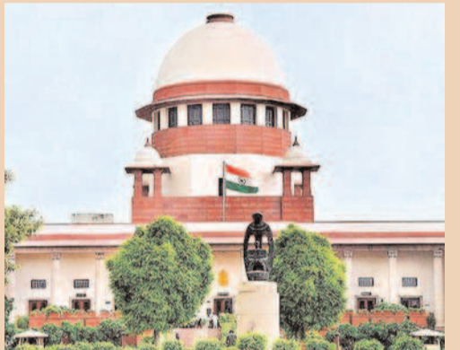
ఆచారాల్లోకి వెళ్లదల్చుకోలేదని కోర్టు తెలిపింది. నిర్దిష్టమైన ఆలయ సంప్రదాయాల కంటే, మత స్వేచ్ఛకు సంబంధించిన ప్రాథమిక హక్కుల పరిధిని తాము సమీక్షిస్తున్నట్లు వెల్లడించింది. వాదనల సమయంలో ఒక మహిళా న్యాయవాది అస్సాంలోని కామాఖ్య ఆలయ ఉదాహరణను కోర్టు ముందు ఉంచారు. అక్కడ మహిళల రుతుస్నాన్ని

రాజ్యాంగపరమైన ప్రశ్నలపైనే మాధ్యమిక ఆలయాల అంతర్గత ఆచారాల్లోకి వెళ్లదల్చుకోలేదు: సుప్రీంకోర్టు