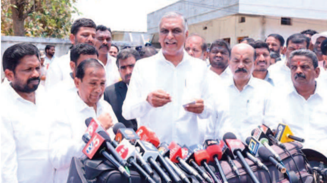
పెడుతున్నారని పోలీసులకు క్రికాంట్ ఫిర్యాదు చేశారని తెలిపారు. కాంగ్రెస్ వాళ్లపై కేసులు పెట్టాల్సింది పోయి ఫిర్యాదు చేసిన వ్యక్తిపై పోలీసులు కేసు పెట్టారని మండిపడ్డారు. నాన్ బెయిలబుల్ కేసు ఎలా పెడతారని

అలాంటి పోలీస్ అధికారులను వదలం మాజీమంత్రి హరీష్ రావు హెచ్చరిక