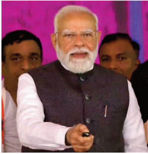
భయరహితంగా బెంగాల్ ఓటరు

హర్యానా/న్యూఢిల్లీ: పశ్చిమ బెంగాల్ అసెంబ్లీ ఎన్నికల పోలింగ్ సరళి, రాజీయే ఫలితాలపై ప్రధానమంత్రి నరేంద్ర మోదీ గెలుపు ధీమాను వ్యక్తం చేశారు. మే 4వ తేదీన వెలువడనున్న ఐదు రాష్ట్రాల ఎన్నికల ఫలితాల్లో బీజేపీ ఘనవిజయం సాధించి 'హ్యూట్రీక్' సమాచారం చేయడం ఖాయమని ఆయన పేర్కొన్నారు. బుధవారం ఉత్తరప్రదేశ్ లోని హర్యానాలో అత్యంత ప్రతిష్టాత్మకమైన 'గంగా ఎక్స్ ప్రెస్ వే' ప్రారంభించిన అనంతరం జరిగిన బహిరంగ సభలో ప్రధాని మాట్లాడారు. బిహార్ అసెంబ్లీ ఎన్నికలు, గుజరాత్ మున్సిపల్ ఎన్నికల్లో సాధించిన విజయాల పరంపర ఐదు రాష్ట్రాల్లోనూ కొనసాగుతుందని, ఈ విజయంతో 'విజృంభణ భారత్' సందేశాన్ని మరింత బలం చేకూరుతుందని ఆయన ఆశాభావం వ్యక్తం చేశారు.