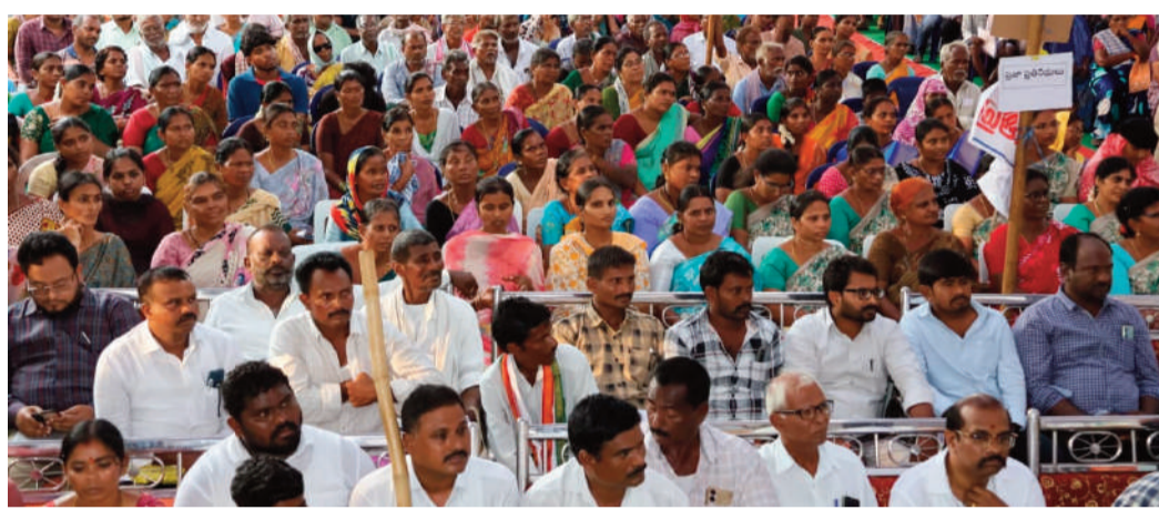
అర్హత ప్రామాణికం.. రాజకీయాలకు అతీతం