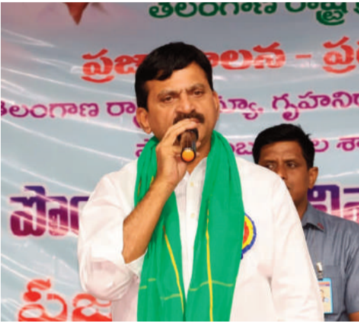
ఖమ్మం, రాజముద్ర న్యూస్:

బోదులబండ ప్రజాదర్బార్లో మంత్రి పాంగులేటి అభయం