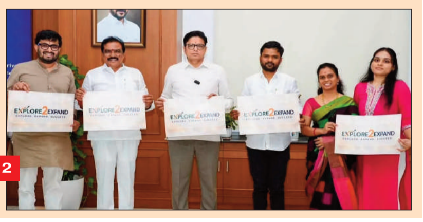
.. వివరాలు 2లో