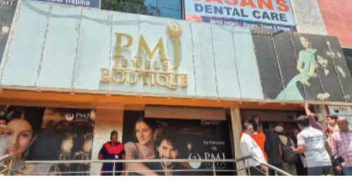
కరీంనగర్ నగరం ఆదివారం పట్టపగలు తుపాకుల మోతతో ఒక్కసారిగా ఉలిక్కిపడింది. అత్యంత రద్దీగా ఉండే ప్రాంతంలోని పీఎంజీ జ్యువెలరీ షాపులో బదుగురు మగతా 2వ పేజీలో..