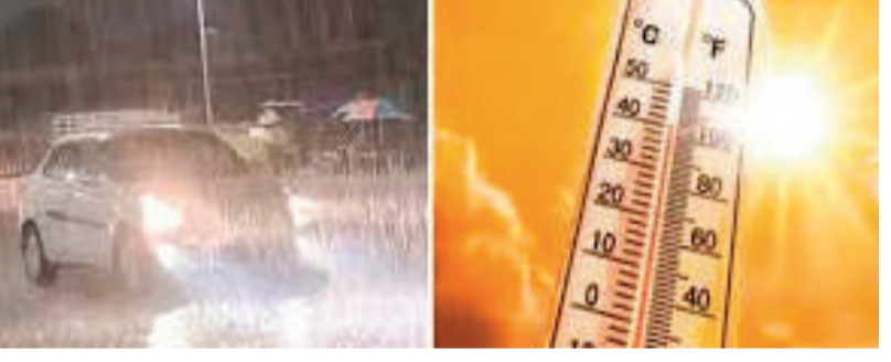
- రాజముద్ర న్యూస్, హైదరాబాద్

పగలు సెగలు.. సాయంత్రం జల్లులు పగలు భానుడి భగభగలు.. సాయంత్రం అకాల వర్షాలు తిరువతి, సిద్దిపేట, కాకినాడలో భిన్న వాతావరణ దృశ్యాలు గాలివానలతో మంటలపై పడుతున్న కోలుకోలేని దెబ్బ