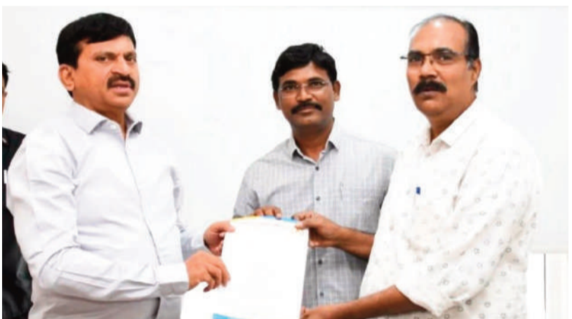
హైదరాబాద్ రాజముద్ర న్యూస్:

* జర్నలిస్టుల సంక్షేమానికి పెద్దపీట వేస్తున్న సీఎం రేవంత్ రెడ్డికి, రాష్ట్ర ప్రభుత్వానికి టీ ఎస్ జే యు ప్రత్యేక కృతజ్ఞతలు..