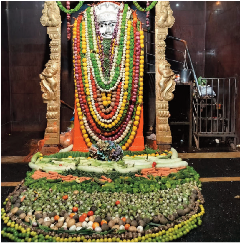
ఘనంగా శ్రీ కాలభైరవ స్వామి కి ప్రత్యేక పూజలు...