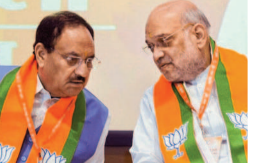
ఆసక్తి నెలకొంది. బీజేపీ అధిష్టానం ఎవరిని నియమిస్తుందో చూడాలి. ప్రస్తుతానికి సువేందు అధికారి పేరు ప్రముఖంగా వినిపిస్తోంది. అసోంలో ఇప్పటికే బీజేపీ నుంచి సీఎంగా ఉన్న హేమంత్ బిశ్వ శర్మ అదే పదవిలో కొనసాగుతారు.

ఎన్నుకుంటారు. ముఖ్యమంత్రి అభ్యర్థిని ఎన్నుకోవడం, కొత్త ప్రభుత్వ ఏర్పాటును షా, మోహన్ చరణ్ నేతృత్వంలో బెంగాల్లో ఈ నెల 9న కొత్త ప్రభుత్వం ఏర్పాటు కానుంది. పశ్చిమ బెంగాల్లో బీజేపీ 207 సీట్లు గెలుచుకుంది. మరోవైపు అసోం సంబంధించి ప్రభుత్వ ఏర్పాటుకోసం కేంద్ర పరిశీలకుడిగా కేంద్ర మంత్రి, బీజేపీ మాజీ జాతీయాధ్యక్షుడు జేపీ నడ్డాను బీజేపీ నియమించింది. నడ్డాతోపాటు సహ పరిశీలకుడిగా హరియాణా సీఎం నయాబ్ సింగ్ సైని వ్యవహరిస్తారు. వీరు ఇద్దరూ అసోంలో బీజేపీ కూటమి ప్రభుత్వ ఏర్పాటు, లెజిస్లేటివ్ పార్టీ లీడర్ ఎన్నికను పర్యవేక్షిస్తారు. అసోంలో బీజేపీ కూటమి 82 సీట్లు గెలుచుకుంది. పశ్చిమ బెంగాల్లో బీజేపీ తొలిసారి అధికారం చేపట్టబోతుంది. దీంతో ముఖ్యమంత్రి అభ్యర్థి విషయంలో