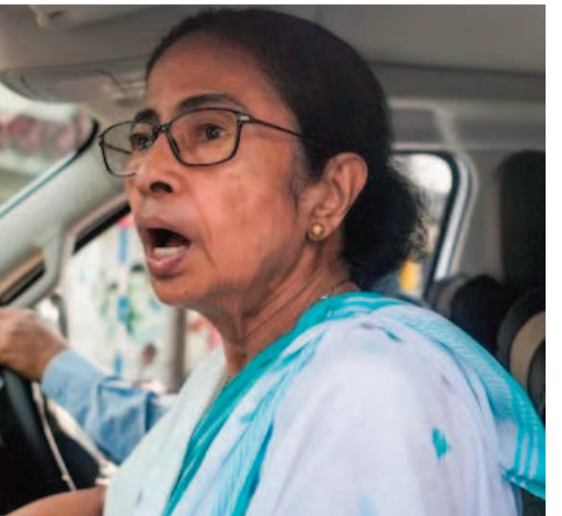
మొత్తం ఉదంతంలో 'ఇండి' కూటమి తన వైపే ఉందని తెలిపారు. ఎన్నికల ఫలితాల అసంతరం సోనియాగాంధీ, రాహుల్ గాంధీ తనతో మాట్లాడారని, అఖిలేష్ యాదవ్, తేజస్వి యాదవ్, హేమంత్ సోరెన్ తదితరులు ఫోను చేసి సపోర్ట్గా నిలిచారని చెప్పారు. 'ఇండి' కూటమిలోనే తాను కొనసాగుతానని కూడా స్పష్టం చేశారు.

అమిత్ షా, ప్రధాని మోడీ కలసి కుట్రలు చేశారని మండిపడ్డారు. 'ఈ ఎన్నికల్లో విలన్గా ప్రధాన ఎన్నికల కమిషనర్ వ్యవహరించారు. బెంగాల్లో ఈవీఎలను లూటీ చేశారు' అని మమత ఆరోపించారు. ఎలక్ట్రానిక్ ఓటింగ్ మిషన్లు పోలింగ్ ముగిసిన తర్వాత కూడా 80 నుంచి 90 శాతం కంటే ఎక్కువ బ్యాలెటరీని కలిగి ఉండటం ఏమిటని ప్రశ్నించారు. పోలింగ్కు రెండ్రోజుల అరెస్టులు చేశారని అన్నారు. భవనీపురిలో ఉద్దేశపూర్వకంగానే ఒక షాన్ ప్రకారం తనను ఓడించారని, ఎన్నికల కమిషనరు దుర్వినియోగపరిచి బీజేపీ విజయం సాధించిందని, తన జీవితంలో ఎప్పుడూ ఇలాంటి ఎన్నికలు చూడలేదని అన్నారు. కౌంటింగ్ సెంటర్లో టీఎస్ఎస్ కార్యకర్తలను కొట్టారని, తనను 'సీఆర్పీఎఫ్ గూండాలు' ఘోషించుతూ తన్ని కౌంటింగ్ సెంటర్ నుంచి గెంటేశారని తీవ్రాపోషణలు చేశారు. ఎన్ఐఆర్ నుంచి 90 లక్షల ఓట్లను తొలగించారని, కోర్టుకు వెళ్లడంతో 32 లక్షల ఓట్లు చేర్చారని, టీఎస్ఎస్ ఓడించేందుకు అన్నిరకాలూ ఎత్తుగడలు పన్ను 100 సీట్ల వరకూ బీజేపీ లూటీ చేసిందని విమర్శించారు. ఈ