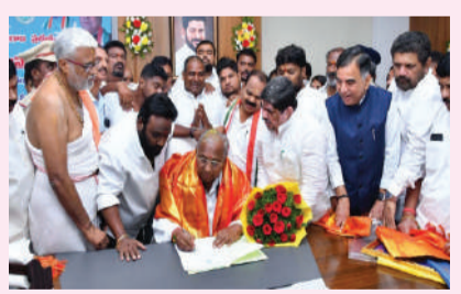
మగతా 3వ పేజీలో..

కరీంనగర్, మే 14 (రాజముద్ర న్యూస్): కరీంనగర్ పట్టణంలో సంవలసం రేపిన పీఎంజే జ్యువలర్ షాపు దోపిడీ కేసును పోలీసులు చేదించారు. ఈ ఘటనకు పాల్పడిన అంతర్జాతీయ ముఠాకు చెందిన ముగ్గురు నిందితులను అరెస్ట్ చేసినట్లు కమిషనర్ గౌస్ ఆలం వెల్లడించారు. కేసులో మొత్తం 13 మంది నిందితులను గుర్తించామని, పరారీలో ఉన్న మిగిలిన వారి కోసం ప్రత్యేక బృందాలు