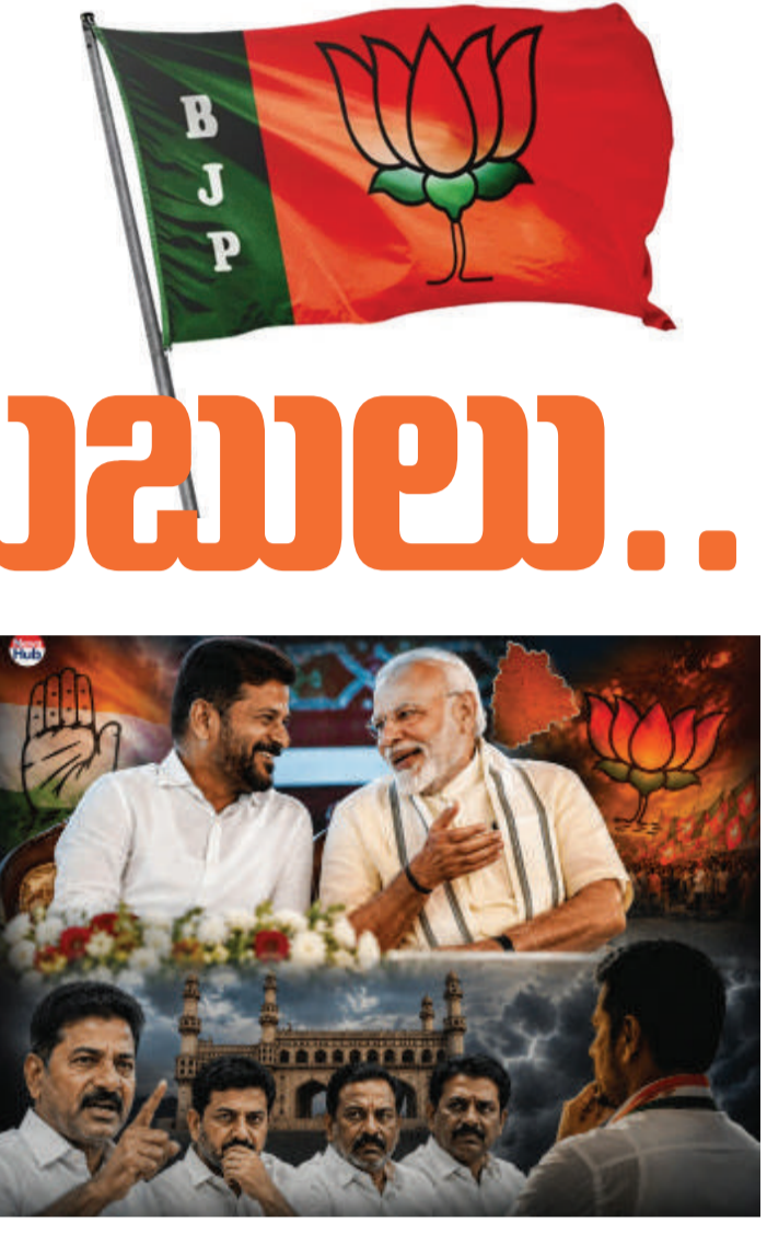
మగతా 2వ పేజీలో..

హైదరాబాద్, మే 14 (రాజముద్ర న్యూస్): మోడీ సారీ ప్రధానిగా భార్యత్వం చేపట్టిన తర్వాత తొలి హైదరాబాద్ పర్యటనలో ప్రధాని నరేంద్ర మోదీ ప్రదర్శించిన రాజకీయ శైలి తెలంగాణ రాజకీయాల్లో కొత్త చర్చలకు తెరలేపింది. అభివృద్ధి కార్యక్రమాల ప్రారంభోత్సవ వేదికపై సీఎం రేవంత్ రెడ్డితో మోదీ సరదా సంభాషణలు, నవ్వులు, పరస్పర అనుబంధం కేవలం ప్రోటోకాల్ పరిమితి కాదనే విశ్లేషణలు జోరందుకున్నాయి. ముఖ్యంగా "గుజరాత్ కు మించిన అభివృద్ధి కావాలంటే మాతో చేతులు కలపాలి" అన్న మోదీ వ్యాఖ్య, దానికి రేవంత్ నవ్వుతూ స్పందించిన తీరు తెలంగాణ కాంగ్రెస్ లో గుబులు రేపుతుండగా, బీజేపీ వ్యూహాలపై