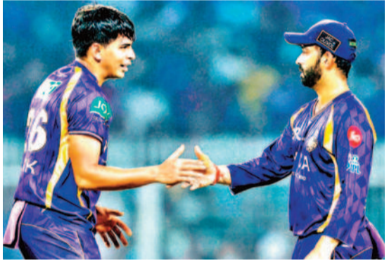
ఫ్లేట్ ఆఫ్స్ ఆశలు సజీవం..