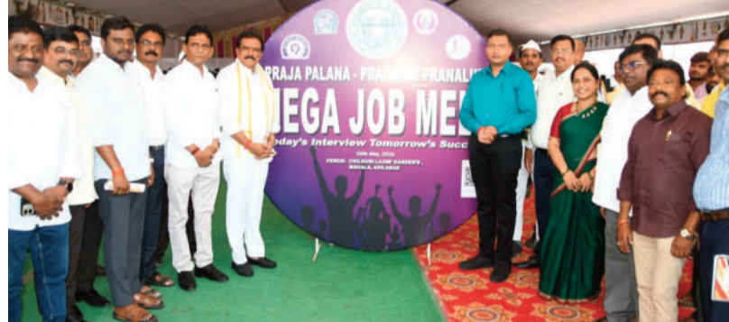
చూపించేందుకు ఒకే వేదికపై 63 ప్రముఖ కంపెనీలను 16వేల ఉద్యోగ అవకాశాలతో తీసుకువచ్చినట్లు తెలిపారు. ప్రస్తుత పోటీ ప్రపంచంలో కేవలం డిగ్రీలు మాత్రమే సరిపోవని, యువత సాంకేతిక నైపుణ్యాల, కమ్యూనికేషన్ స్కిల్స్ను పెంపొందించుకోవాలని సూచించారు. ప్రభుత్వ ఉద్యోగాల కోసమే ఎదురు చూడకుండా ప్రైవేట్ రంగంలో లభించే అవకాశాలను కెరీర్లో ఒక మెట్టుగా భావించి ముందుకు సాగాలని అన్నారు. గ్రామీణ ప్రాంతాల యువత అద్దె