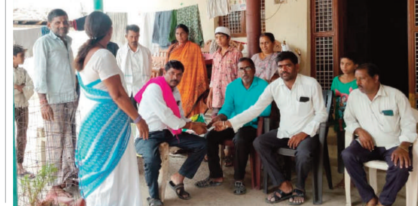
ఆరోగ్యంపై ప్రత్యేక శ్రద్ధ వహించాలి