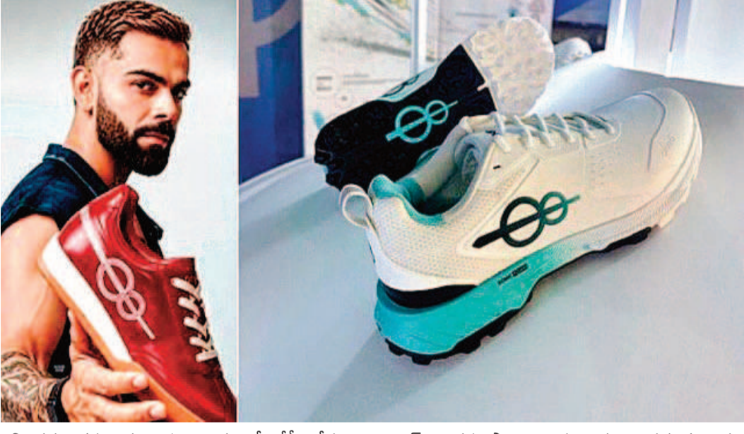
లభించడం గమనార్వం. ఈ విజయంతో కోహ్లా కేవలం ఐకాన్గా తన స్థానాన్ని మరింత బలపరుస్తున్నారని క్రికెటర్లుగా మాత్రమే కాకుండా, గ్లోబల్ స్పోర్ట్స్ బ్రాండ్ మార్కెట్ విశ్లేషకులు పేర్కొంటున్నారు.

ముంబై, జూన్ 25 : టీమిండియా స్టార్ క్రికెటర్ విరాట్ కోహ్లా మరోసారి తన బ్రాండ్ విలువతో వార్తల్లో నిలిచాడు. ఆయన ప్రారంభించిన 'వన్8' గ్లోబల్ షూ బ్రాండ్ లాంచ్ అయిన కేవలం 24 గంటల్లోనే లక్షన్నర జతలు అమ్ముడై సరికొత్త రికార్డు సృష్టించాయి. ఈ అమ్ముకాలతో ఒక్కరోజులోనే రూ.138 కోట్లకు పైగా ఆదాయం వచ్చినట్లు మార్కెట్ వర్గాలు అంచనా వేస్తున్నాయి. క్రీడారంగంలో మాత్రమే కాకుండా వ్యాపార ప్రపంచంలోనూ కోహ్లాకి ఉన్న క్రేజ్ ఈ ఫలితాలతో స్పష్టమవుతోందని నిపుణులు చెబుతున్నారు. ఈ షూస్ ధరను కోహ్లా టెస్ట్ క్రికెట్లో సాధించిన 9,230 పరుగులకు గుర్తుగా రూ.9,230గా నిర్ణయించడం ప్రత్యేక ఆకర్షణగా మారింది. ప్రీ-బుకింగ్ ఆధారంగా మాత్రమే అమ్ముకాలు జరగడంతో అభిమానుల్లో భారీ ఆసక్తి నెలకొంది. లాంచ్ ఈవెంట్లో పాల్గొన్నదానికి కూడా ప్రత్యేకంగా ప్రీ-బుక్ చేసిన కొనుగోలుదారులకే అవకాశం కల్పించారు. అయినప్పటికీ అభిమానుల నుంచి ఊహించని స్థాయిలో స్పందన