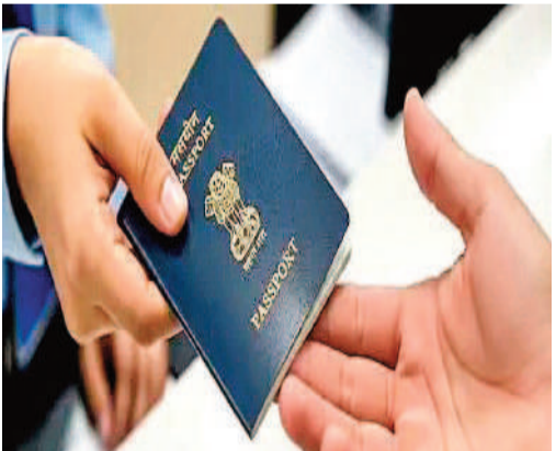
14 ఏళ్ల తర్వాత మరోసారి ఫీజులను పెంచడం గమనార్హం.

పాస్ పోర్టు పోగొట్టుకున్న వారు కొత్తగా 36 పేజీల పాస్ పోర్టు పొందాలంటే ఇకపై రూ.5,000 చెల్లించాల్సి ఉంటుంది. తర్వాత విధానంలో ఈ ఫీజు రూ.7,500గా నిర్ణయించారు. 60 పేజీల పాస్ పోర్టు విషయంలో సాధారణ ఫీజు రూ.6,000 కాగా, తర్వాత ద్వారా దరఖాస్తు చేసుకుంటే రూ.8,500 చెల్లించాల్సి ఉంటుంది. పాస్ పోర్టు నిబంధనల్లో మార్పులు చేస్తూ విదేశాంగ శాఖ కొత్త ఫీజులను ప్రకటించింది. చివరిసారిగా 2012లో పాస్ పోర్టు రుసుములను సవరించగా, ఇప్పుడు