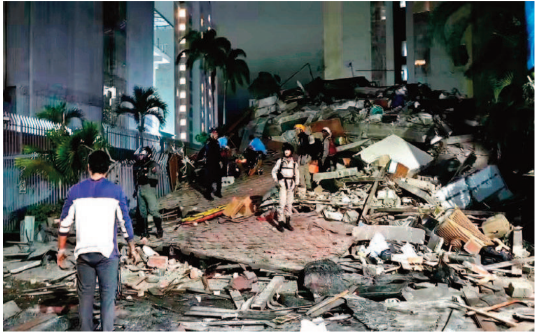
ప్రకటించారు. అమెరికా అధ్యక్షుడు డొనాల్డ్ ట్రంప్ కూడా సహాయక చర్యలకు అవసరమైన మద్దతు అందిస్తామని వెల్లడించారు.