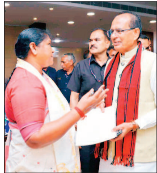
ఉపాధి హామీలో పాత వాటాను..

న్యూఢిల్లీ జూన్ 29 : ఢిల్లీ వేదికగా జరిగిన జాతీయ గ్రామీణాభివృద్ధి సదస్సులో తెలంగాణ గళాన్ని రాష్ట్ర మంత్రి సీతక్క బలంగా వినిపించారు. కేంద్ర ప్రభుత్వం కొత్తగా తెస్తున్న 60:40 నిధుల విధానంపై తీవ్ర అభ్యంతరం వ్యక్తం చేశారు. కేంద్రమంత్రి శివరాజ్ సింగ్ చౌహాన్ ను కలిసి పెండింగ్ నిధులు, అటవీ అనుమతులపై కీలక వినతిపత్రం సమర్పించారు. కేంద్ర ప్రభుత్వం గ్రామీణాభివృద్ధి పథకాలకు సంబంధించి తీసుకొస్తున్న కొత్త నిధుల విధానంపై రాష్ట్ర మంత్రి సీతక్క తీవ్ర అసంతృప్తి వ్యక్తం చేశారు. సోమవారం ఢిల్లీలో జరిగిన జాతీయ సదస్సులో ఆమె పాల్గొన్నారు. వికసిత గ్రామాలు 2047 అశయం నెరవేరాలన్నా, పల్లెలు స్వయంసహృద్ధి సాధించాలన్నా రాష్ట్రాలపై కేంద్రం అదనపు ఆర్థిక భారం మోపకూడదని ఆమె స్పష్టం చేశారు. కొత్తగా ప్రతిపాదించిన 60:40 నిధుల విధానంతో రాష్ట్రాలపై ఉపాధి హామీ రీతిలో భారం పడుతుందన్నారు. ఈ నిబంధనలపై జూలై 2 న జరగబోయే రాష్ట్ర క్యాబినెట్ సమావేశంలో తుది నిర్ణయం తీసుకుంటామని వెల్లడించారు.