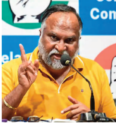
గాంధీ ఎంపీలను పంపించి పూర్తి వివరాలు సేకరించాలని సూచించారని తెలిపారు.